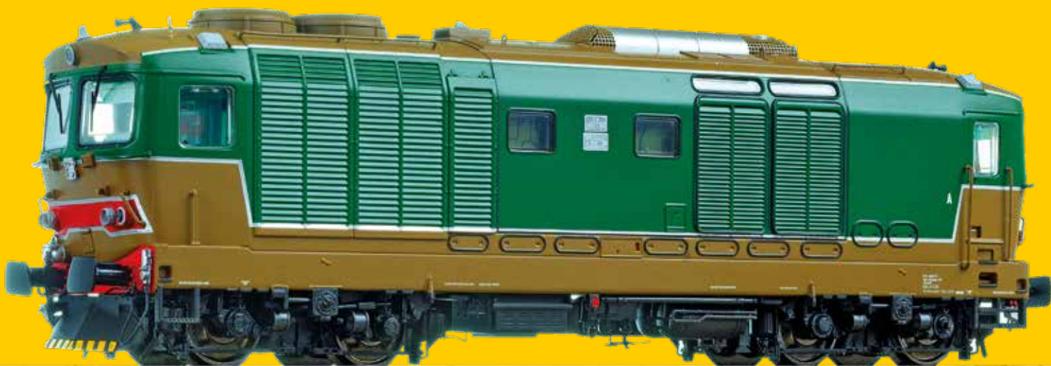
CAMPIONE DI PROVA NON DEFINITIVO